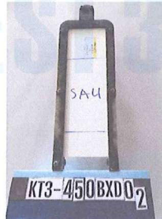
Sau khi thử/ After testing