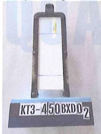
Trước khi thử/ Before testing

LOD: Giới hạn phát hiện/ Limit of detection