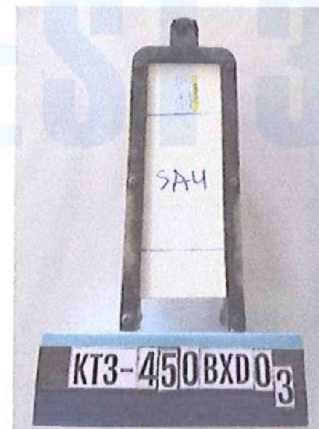
Sau khi thử/ After testing