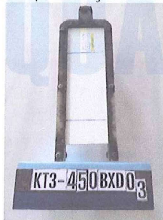
Trước khi thử/ Before testing

LOD: Giới hạn phát hiện/ Limit of detection